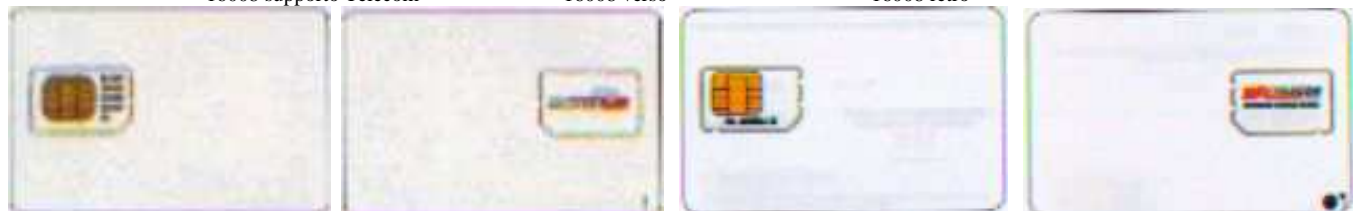
16009 verso 16009 retro 16010 verso 16010 retro