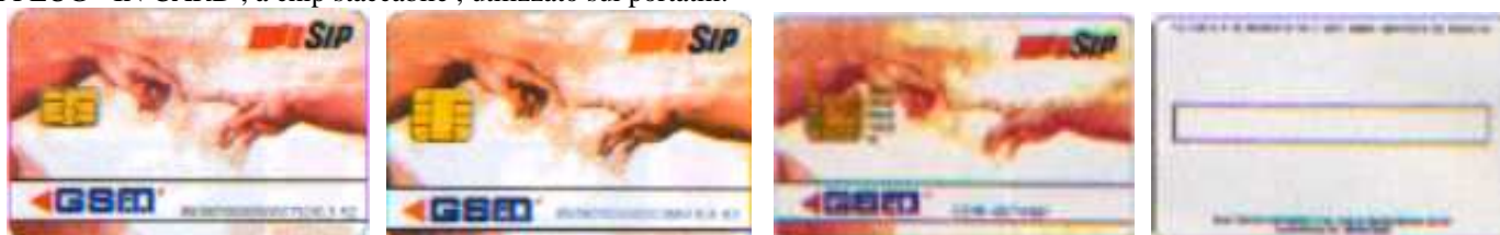
16000 verso 16001 verso 16003 verso 16000 - 16001 - 16003 retro

Dati Tecnici : Le prime schede con Chip sono state realizzate per la GSM ( GLOBAL system for mobile communication ) . Queste schede consentono , trovandosi all' estero , di utilizzare il servizio ( Roaming International ) . La particolarità di questo esercizio sta nel fatto che i dati , dell' utente , non sono inseriti nel cellulare , bensì nella scheda ( Sim - Card ) Sub Subscriber Identity Module . Si può in questo modo inserire questa scheda in un qualsiasi telefono portatile che , nel momento dell'uso , utilizzerà i dati fornitegli dalla scheda , per essere collegati in rete . Ne esistono di due tipi : l' ISOCARD , utilizzato sui telefoni installati a bordo dei veicoli , e il PLUG - IN CARD , a chip staccabile , utilizzato sui portatili.