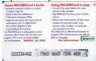
5, / 1, / 2, / 3 Apr. retro