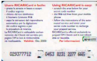
5, / 1 / 2, / 3 Giu. retro