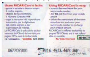
6, / 1, / 2, / 3, / Set. retro