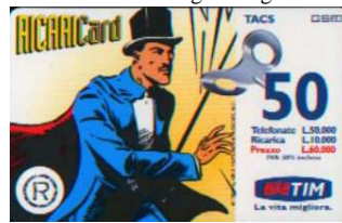
6 Apr - 6/3 Set. verso