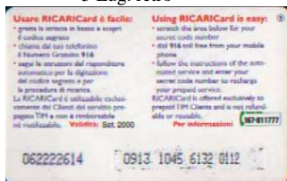
5, / 1, / 2, / 3 Set. retro