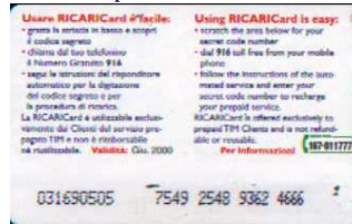
6, / 1, / 2, / 3 / 4 Giu. retro