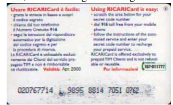
6, / 1 Apr. retro