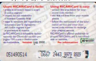
5/ N Lug. retro