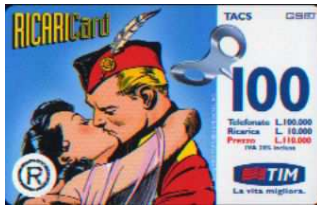
5 Apr - 5/3 Set verso

Dati tecnici : Ricariche realizzate dalla Publiccenter s.r.l. Divisione Technicard in Cloruro di Polivinile ( PVC ) aventi filigrana piana e indicazioni in Italiano e in Inglese . Pur utilizzando gli stessi personaggi della King Features Syndicate , creati da Lee Falk , le Ricariche subiscono una trasformazione. Cambia colore , nelle 5 e 6 la zona , dove ci sono le indicazioni di esercizio : da azzurro a bianca . La scritta G S M nelle 5 e 6 diviene lunga 7,5 mm , e il valore di esercizio , che è espresso solo in cifre , alto 11,5 mm. Sotto il Logo TIM “ La vita migliore “ lunghi 19 mm. Al retro il numero verde 167 - 011777 e , nell' indicazione per l' uso della Ricarica , la dicitura : “ Gratta la striscia in basso e scopri il codice segreto “ . Le Ricariche , il cui numero di Catalogo è seguito da una N , hanno la filigrana in negativo .