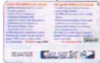
5 Lug. retro