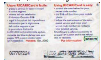
6/ 1 N retro