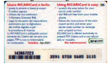
10 M/ 2 Apr. retro