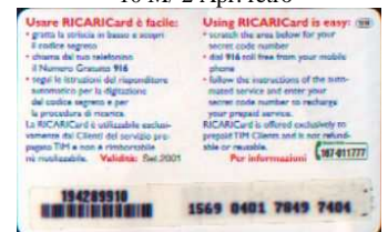
10 M Set. retro