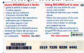
10 M Giu. retro