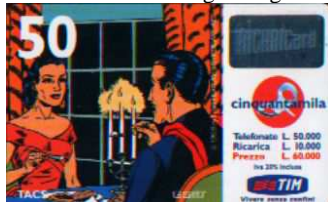
10 M Apr. - 10 M Dic. verso