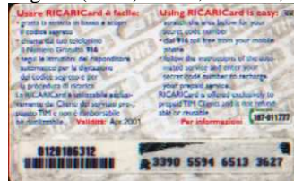
10 M/ 1 N Apr. retro