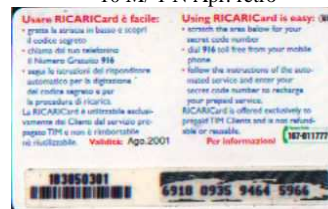
10 M Ago. retro