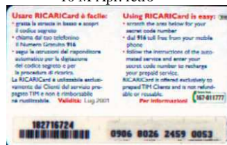
10 M Lug. retro