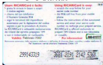
G - O Feb. retro