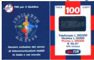
G - O Dic.- Gen. verso