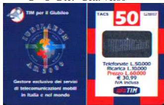
G - O Feb. verso