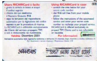
G - O Dic. retro