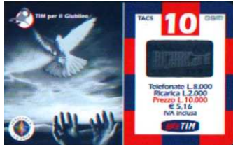
GCO-M Apr. - Set. verso

Dati tecnici : Le Ricariche GCO-M , realizzate dalla Mantegazza , in Cloruro di Polivinile ( PVC ) , hanno sul lato sinistro la “ chiavetta “, locata in un tondo bianco , una colomba bianca , che si leva in volo lanciata da mani protese , e il logo (cinque colombe, espressione dei cinque continenti ) dell'Anno Santo , evento , voluto da Papa Bonifacio VIII nel 1300 , che non poteva essere ignorato dalla TIM . E' un doveroso riconoscimento alla Cristianità , ma anche ad un grande Papa , Giovanni Paolo II , quel colui che , con il Suo modo pastorale ( Giovanni XXIII ) e politico ( Paolo VI ) ha cambiato la Storia del mondo . Sul lato destro , circoscritto da una cornice multicolore , i dati d'esercizio , in cifre, alte 7,5 mm . Il costo della Ricarica è indicato anche in Euro ( € 5,16 ). In alto TACS di 5 mm e G S M di 6 mm . Al centro l'ologramma RICARICARD , di 24,5 x 13,5 mm e in basso il Logo TIM di 13,5 mm senza motto. Sul retro , che ha filigrana piana e indicazioni in italiano e in Inglese , “ Usare RICARICard è facile “ ,” Gratta la striscia in basso e scopri il codice segreto “ed ETU 4. Per le informazioni l'Assistenza Clienti 119 e il numero verde 800- 011777. Il Codice Numerico, posto sopra il Codice a Barre, e il Codice Segreto ( PIN ), che è ricoperto da un Pigmento di colore Azzurro Grigiastro, sono protetti da una membrana di plastica trasparente di 80 x 16 mm . Hanno l'indicazione “ dial 916 toll free from your mobile phone “ , posta su due righe .