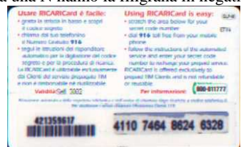
GLP-M Set. retro