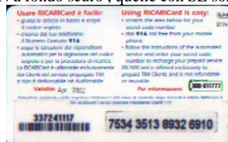
GLP-M Apr. retro