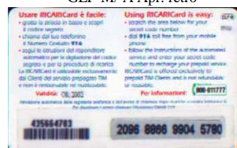
GLP-M/ 1A Ott. retro