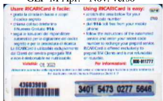
GLP-M/ A Ott. retro