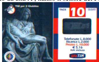
GLP-M Apr. - Nov. verso