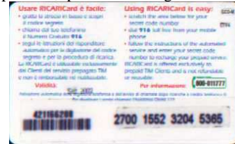
GCO-M Sett. retro