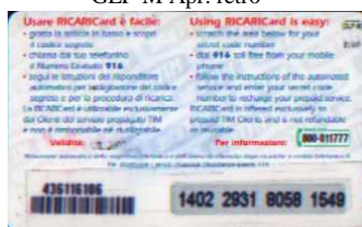
GLP-M/ AN Ott. retro