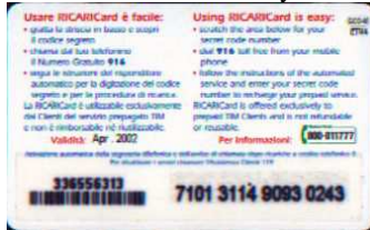
GCO-M Apr. retro