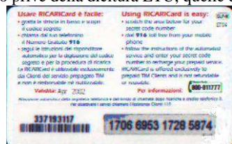
GLP-M/ A Apr. retro