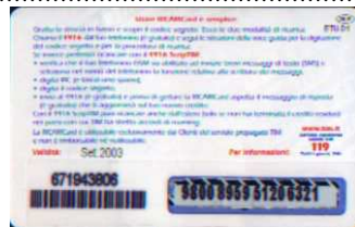
26 - P Set. 03 retro