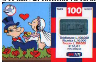
29-O Apr. - Giu. 03 verso

Dati tecnici : Le Ricariche 29-O , realizzate dalla Oberthur C..S , in Cloruro di Polivinile ( PVC ) , hanno sul lato sinistro la “ chiavetta “, locata in un tondo bianco , e i personaggi della KFS , Braccio di ferro e Olivia , su fondo celeste (chiaro) o (scuro) , che valgono il 20 % in più ) . Sul lato destro , circoscritto da una cornice multicolore, i dati d’esercizio, in cifre, alte 5,5 mm . Il costo della Ricarica è indicato anche in Euro ( € 56,81 ) . In alto TACS di 5,5 mm e G S M di 6mm. Al centro l’ologramma RICARICARD , di 24,5 x 13,5mm, e in basso il Logo TIM di 13,5mm senza motto. Sul retro, che ha filigrana piana e indicazioni in italiano , con caratteri marcati e sottili , “ Usare RICARICard è semplice “ , ” Gratta la striscia in basso e scopri il codice segreto “ed ETU D Per Ricaricare 916 o 916 ScripTIM . Sopra il numero verde 800- 011777 , posto in un cartello di 10 mm , c’è www.tim.it . Sulle Ricariche di Aprile i caratteri numerici sono “ PICCOLI “ ( alti 3 mm nelle 29-O, 29-O/ 1 e 29-O/ 2 ) e “ GRANDI “ ( alti 3,5 mm nelle 29-O/ 3 , 29-O/ 3 N, 29-O/ 4, 29-O/ 5 , 29-O/ 6 , 29-O/ 7 ) Il Codice Numerico, posto sopra il Codice a Barre, e il Codice Segreto ( PIN ) , che è stampato , su un supporto di colore grigio, ed è ricoperto da un Pigmento di colore Azzurro Grigiastro, Blu , grigio, sono protetti da una membrana di plastica trasparente di 80 x 16 mm . Le Ricariche , il cui numero di Catalogo è seguito da una N , hanno la filigrana in negativo .