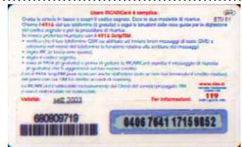
26 - P/ 4 26 Sett. 03 retro