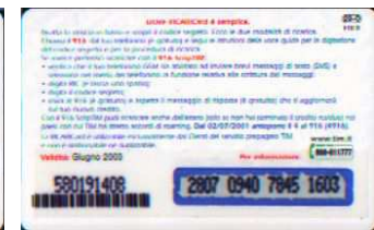
29-O Giu. 03 retro