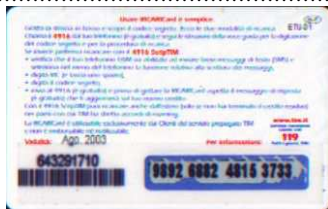
26 - P Ago. 03 retro