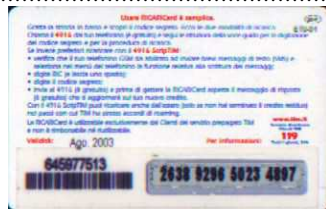
26 - P/ 1 Ago. 03 retro