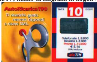
AR-O Lug. 03 verso

Dati tecnici : Le Ricariche AR-O, realizzate dalla Oberthur C. S., in Cloruro di Polivinile ( PVC ), hanno sul lato sinistro la chiavetta e “Autoricarica 190 Ti ricarichi gratis mentre rispondi e ricevi SMS “. Sul lato destro, circoscritto da una cornice multicolore, i dati d'esercizio, in cifre, alte 7,5 mm . Il costo della Ricarica è indicato anche in Euro ( € 5,16 ). In alto TACS di 5,5mm e G S M di 6 mm. Al centro l'ologramma RICARICARD , di 24,5 x 13,5 mm , e in basso il Logo TIM di 13,5 mm senza motto. Sul retro, che ha filigrana piana e indicazioni in italiano, “ Usare RICARICard è semplice “ , ” Gratta la striscia in basso e scopri il codice segreto “ ed ETU D 1. Per Ricaricare 4916 o 4916 ScripTIM. Sopra il servizio assistenza clienti 119 c'è www.tim.it . Il Codice Numerico, posto sopra il Codice a Barre, e il Codice Segreto ( PIN ), che è stampato su un supporto, di colore, grigio giallastro o grigio , ed è ricoperto da un Pigmento di colore Azzurro Grigiastro , celeste o giallo , sono protetti da una membrana di plastica trasparente di 80 x 16 mm. ed hanno i caratteri MARCATI nelle AR-O e AR-O/ 1 e SOTTILI nelle AR-O/ 2 N e AR-O/ 3 . Le Ricariche , il cui numero di Catalogo è seguito da una N , hanno la filigrana in negativo .