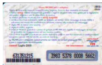
AR-O/ 3 N Lug. 03 retro