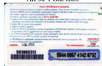
AR-M/ 3 Lug. retro