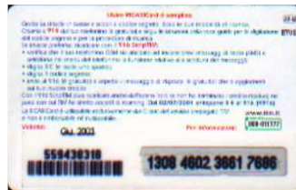
AR-M Giu. retro