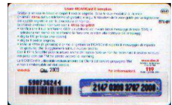
AR-M/ 5 Giu. retro