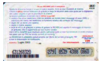
AR-O/ 3 Lug. 03 retro