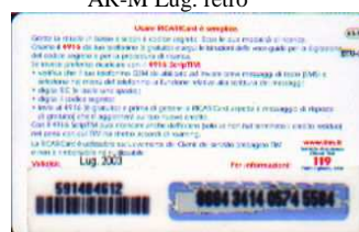
AR-M/ 5 Lug. retro