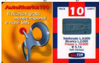
AR-M Giu. - Lug. verso