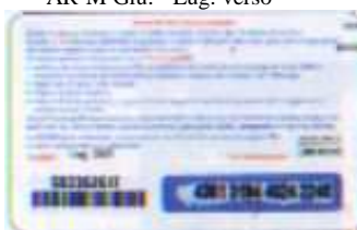
AR-M Lug. retro