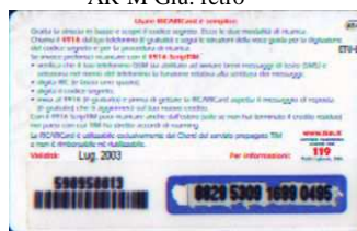
AR-M/ 1 Lug. retro