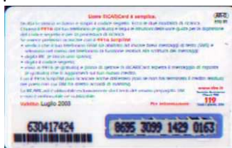
AR-O Lug.03 retro