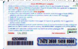
TOUR-P Lug. retro