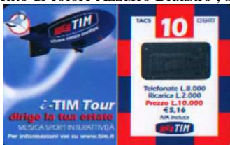
TOUR-P Lug. verso

Dati tecnici : Le Ricariche TOUR-P, realizzate dalla Publiccenter s. r. l. Divisione Technicard , in Cloruro di Polivinile ( PVC ), hanno sul lato sinistro la “ chiavetta “, locata in un tondo bianco , il Dirigibile TIM , che ci invita a “ vivere senza confini “ e “ i -TIM Tour dirige la tua estate - Musica -Sport - Interattività. Per informazioni vai su www.tim.it “. Sul lato destro , circoscritto da una cornice multicolore , i dati d'esercizio, in cifre , alte 6,5 mm e in lettere . Il costo della Ricarica è indicato anche in Euro ( € 5,16 ) . In alto TACS di 5,5 mm e G S M di 6 mm. Al centro l'ologramma RICARICARD , di 25,5 x 13,5mm , e in basso il Logo TIM di 14mm senza motto.Sul retro, che ha filigrana piana e indicazioni in italiano, “ Usare RICARICard è semplice”, ” Gratta la striscia in basso e scopri il codice segreto “ ed ETU D-1 . Per Ricaricare 916 o 916 ScripTIM. Sopra il numero verde 800-011777 , in un cartello di 10 mm , c'è www.tim.it . Il Codice Numerico, posto sopra il Codice a Barre, e il Codice Segreto ( PIN ), che è stampato su un supporto di colore grigio , ed è ricoperto da un Pigmento di colore Azzurro Bluastro , sono protetti da una membrana di plastica trasparente di 80 x 16 mm..