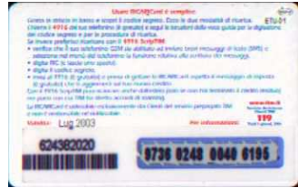
WAP-P/ 3 Lug. retro