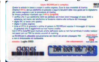
WAP-O/ 4 Luglio retro