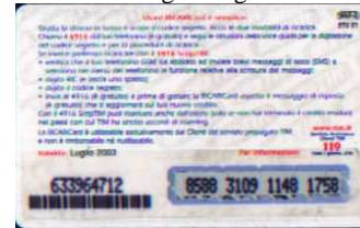
WAP-O/ 2 N Luglio retro