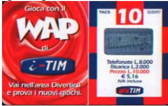
WAP-P Lug. verso

Dati tecnici : Le Ricariche WAP-P, realizzate dalla Publiccenter s. r. l. Divisione Technicard , in Cloruro di Polivinile ( PVC ), hanno sul lato sinistro “ Gioca con il WAP di i -TIM. Vai nell'area Divertirsi e prova i nuovi giochi “. Sul lato destro, circoscritto da una cornice multicolore, i dati di esercizio, in cifre, alte 6,5mm e in lettere. Il costo della Ricarica è indicato anche in Euro ( € 5,16). In alto TACS di 5,5mm e GSM di 6mm. Al centro l'ologramma RICARICARD , di 25,5 x 14mm , e in basso il Logo TIM di 14mm senza motto. Sul retro, che ha filigrana piana e indicazioni in italiano , “ Usare RICARICard è semplice”, ” Gratta la striscia in basso e scopri il codice segreto “ ed ETU-D 1 . Per Ricaricare 4916 o 4916 ScripTIM. Sopra il Servizio Assistenza Clienti 119 c'è www.tim.it . La Validità è a caratteri grandi e sottili o piccoli in grassetto (DP = data piccola). Il Codice Numerico, posto sopra il Codice a Barre, e il Codice Segreto ( PIN ), che è stampato su un supporto di colore grigiogiallo ( G ), gialloverde(V), ed è ricoperto da un Pigmento di colore Azzurro Grigiastro , verde , sono protetti da una membrana di plastica trasparente di 80 x 16mm . Le Ricariche , il cui numero di Catalogo è seguito da una N , hanno la filigrana in negativo.