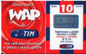
WAP-O Luglio verso

Dati tecnici : Le Ricariche WAP-O, realizzate dalla Oberthur C. S, in Cloruro di Polivinile ( PVC ), hanno sul lato sinistro “ Gioca con il WAP di i - TIM . Vai nell'area Divertirsi e prova i nuovi giochi “. Sul lato destro, circoscritto da una cornice multicolore, i dati d'esercizio, in cifre , alte 7,5 mm e in lettere . Il costo della Ricarica è indicato anche in Euro ( € 5,16 ) . In alto TACS di 5,5 mm e G S M d 6 mm. Al centro l'ologramma RICARICARD , di 24,5 x 13,5mm , e in basso il Logo TIM di 13,5 mm senza motto. Sul retro, che ha filigrana piana e indicazioni in italiano , “ Usare RICARICard è semplice”, ” Gratta la striscia in basso e scopri il codice segreto “ ed ETU D 1 . Per Ricaricare 4916 o 4916 ScripTIM. Sopra il Servizio Assistenza Clienti 119 c'è www.tim.it . Il Codice Numerico in cifre “ Piccole “, alte 3 mm , e “ Grandi “ , alte 3,5 mm , posto sopra il Codice a Barre, e il Codice Segreto ( PIN ), che è stampato su un supporto di colore grigio , ed è ricoperto da un Pigmento di colore Celeste e Azzurro Grigiastro , sono protetti da una membrana di plastica trasparente di 80 x 16mm . Le Ricariche , il cui numero di Catalogo è seguito da una N , hanno la filigrana in negativo.