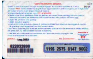
WAP-P/ IN Lug. retro