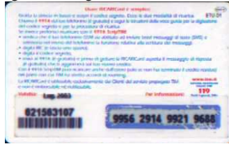
WAP-P/ DP Lug. retro