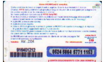
IF5-P/ 11 Mar 2004 retro