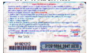
IF5-P/ 17 N Mar 2004 retro