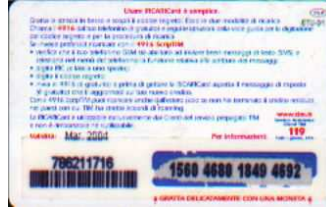
IF5-P/ 1 Mar 2004 retro