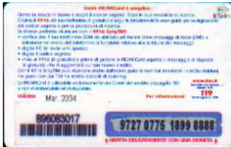
IF5-P/ 6 Mar 2004 retro