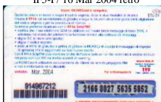
IF5-P/ 21 Mar 2004 retro