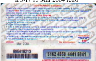
IF5-P/ 18 N Mar 2004 retro