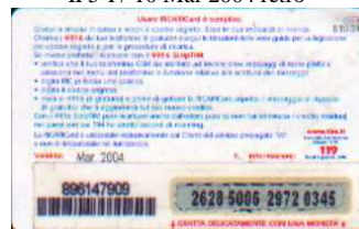
IF5-P/ 16 Mar 2004 retro