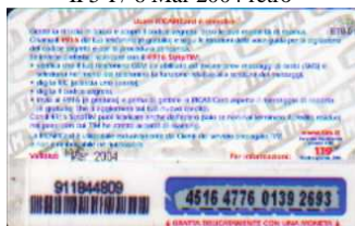
IF5-P/ 15N Mar 2004 retro