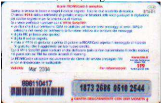
IF5-P/ 5 Mar 2004 retro