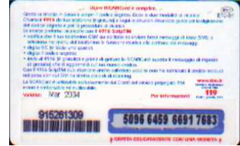
IF5-P/ 4 Mar 2004 retro