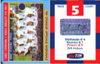
IF5-P Mar., Apr., Mag 2004 verso