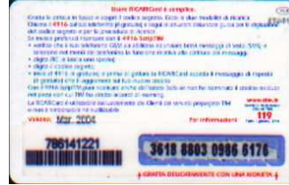
IF5-P/ 2 Mar 2004 retro