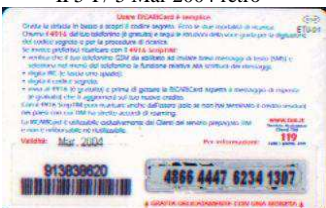
IF5-P/ 13 Mar 2004 retro