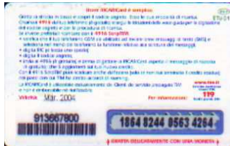
IF5-P/ 10 Mar 2004 retro