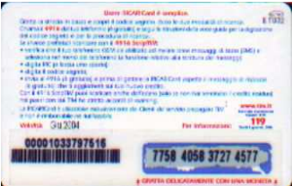
MUT50-P/4 Giu 04 retro