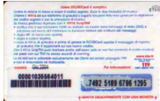
MUT50-P/5 Giu 04 retro