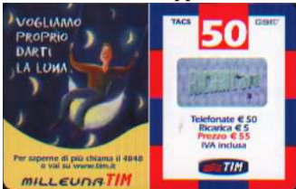
MUT50-P Giu-Lug-Ago-Set 04; Apr 05 verso