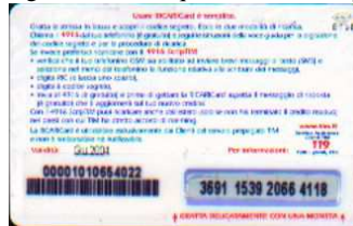
MUT50-P/1 Giu 04 retro