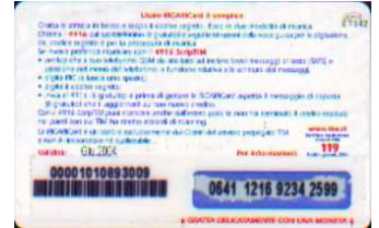
MUT50-P/2 Giu 04 retro