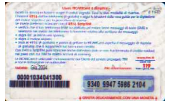
MUT50-P/5N Giu 04 retro