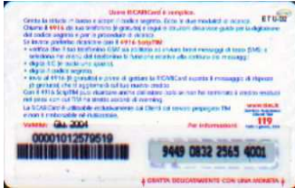
MUT50-P/8 Giu 04 retro