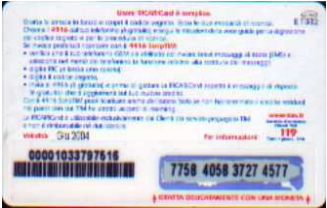
MUT50-P/6 Giu 04 retro