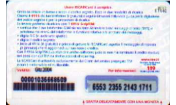
MUT50-P/9DP Giu 04 retro