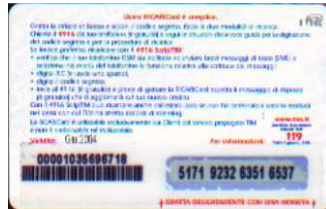
MUT50-P Giu 04 retro