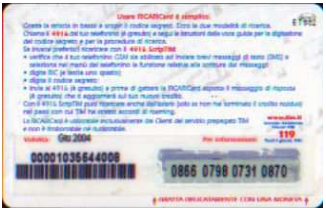
MUT50-P/7 N Giu 04 retro