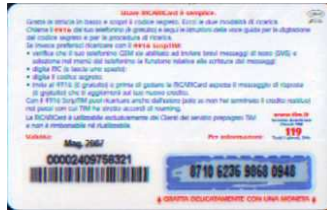
LM4-P/ DP Mag 07 retro