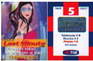
LM4-P Dic 06; Apr-Mag-Giu-Lug-Set 07 verso