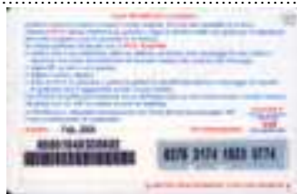
LM4-P/ 2 Feb 06 retro