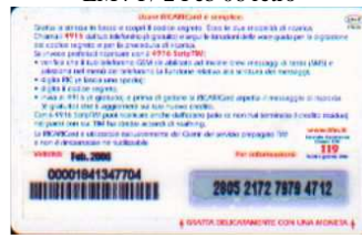
LM4-P/ 6 DP Feb 06 retro