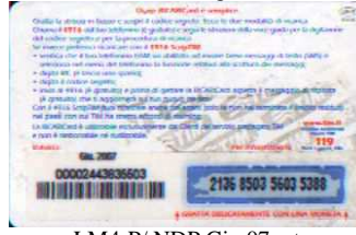
LM4-P/ NDP Giu 07 retro