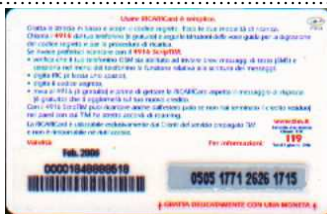
LM4-P/ 5 DP Feb 06 retro