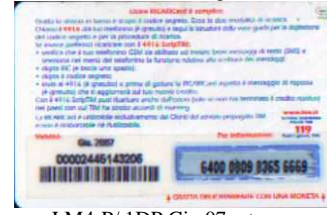
LM4-P/ 1DP Giu 07 retro