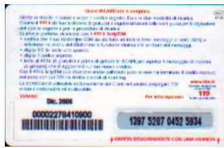
LM4-P/ 2DP Dic 06 retro