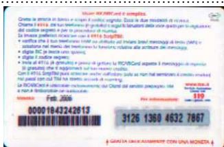
LM4-P/ 3 Feb 06 retro