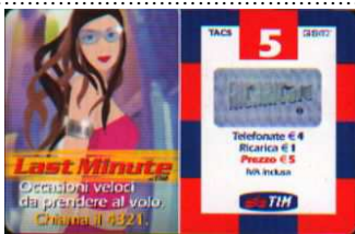
LM4-P Feb 06 verso