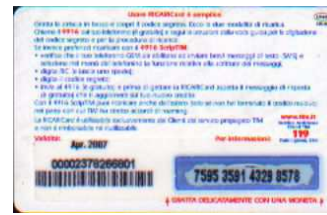
LM4-P/ DP Apr 07 retro