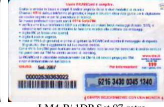
LM4-P/ 1DP Set 07 retro