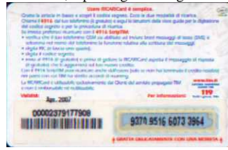
LM4-P/ 2DP Apr 07 retro