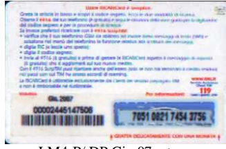
LM4-P/ DP Giu 07 retro