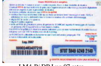
LM4-P/ DP Lug 07 retro