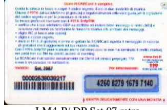
LM4-P/ DP Set 07 retro