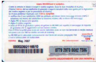
LM4-P/ 1DP Mag 07 retro