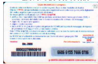
LM4-P/DP Dic 06 retro