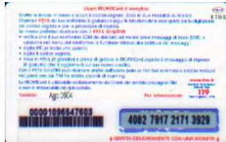
PFM5-P/12CM3 Ago 04 retro