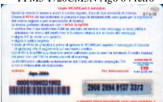
PFM5-P/ 24CCDP Ago 04 retro