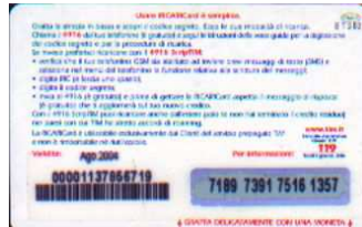
PFM5-P/ CM Ago 04 retro