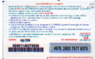
PFM5-P/18CM Ago 04 retro