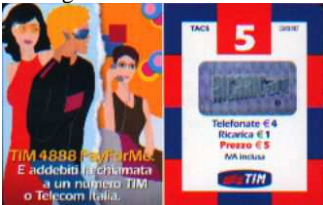
PFM5-P/ CM/ CM3/ CCDP Ago 04 verso