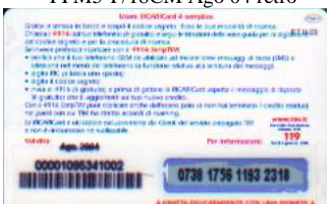
PFM5-P/23CCDP Ago 04 retro