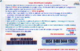
PFM5-P/16CM Ago 04 retro