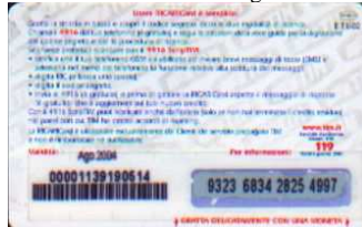
PFM5-P/20CM3N Ago 04 retro