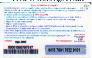
PFM5-P/22CCDP Ago 04 retro