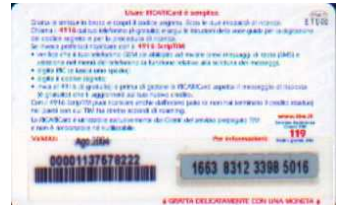
PFM5-P/ 13CM Ago 04 retro