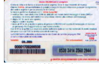
PFM5-P/ 9CCDP Ott 05 retro