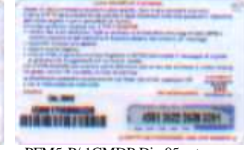
PFM5-P/ 1CMDP Dic 05 retro