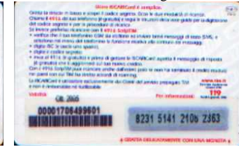
PFM5-P/ 5CC Ott 05 retro