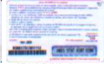
PFM5-P/ CM3 Nov 05 retro