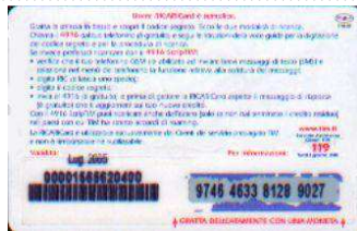
PFM5-P/ CC Lug 05 retro