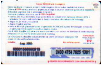
PFM5-P/ 3CC DP Lug 05 retro