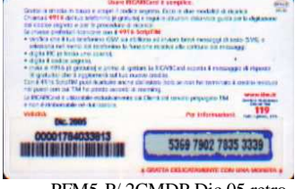
PFM5-P/ 2CMDP Dic 05 retro