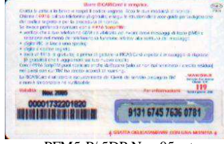
PFM5-P/ 5DP Nov 05 retro