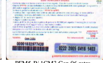
PFM5-P/ 1CM3 Gen 06 retro