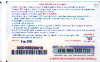
PFM5-P/ 2CSDP Lug 05 retro