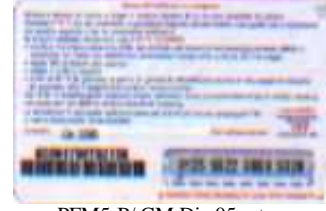
PFM5-P/ CM Dic 05 retro