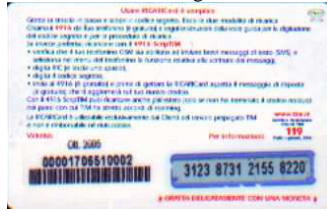
PFM5-P/ CM3 Ott 05 retro