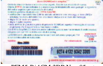
PFM5-P/ 1CM 3DP Nov 05 retro