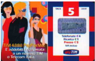
PFM5-P Lug-Ott-Nov-Dic 05; Gen 06 verso