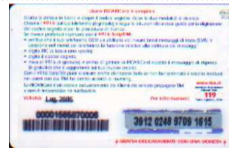
PFM5-P/ 1CCDP Lug 05 retro