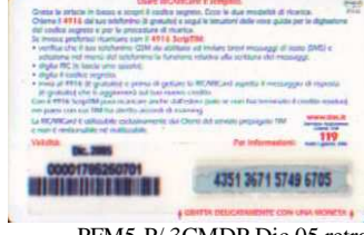
PFM5-P/ 3CMDP Dic 05 retro