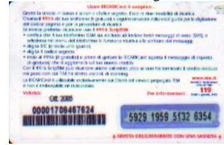
PFM5-P/ 3CS Ott 05 retro