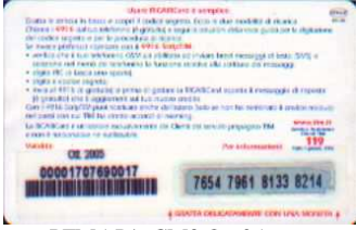
PFM5-P/ 6CM3 Ott 05 retro