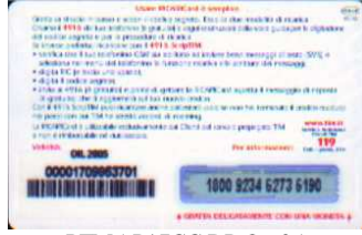
PFM5-P/ 7CC DP Ott 05 retro