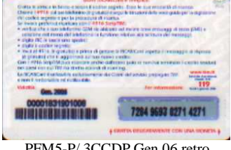
PFM5-P/ 3CCDP Gen 06 retro