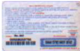
MTP30 - P/ 1CSDP Mar 07 retro