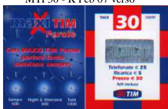
MTP30 - K/ 4CCPO Feb 07 verso