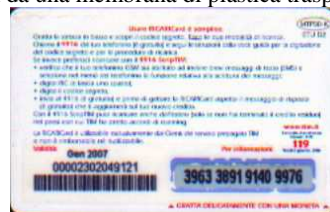
MTP30 - K/ CC Gen 07 retro