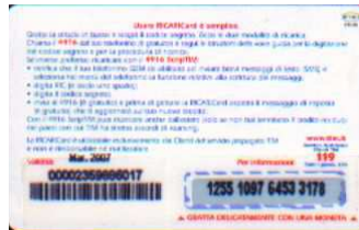
MTP30 - P/ CCDP Mar 07 retro