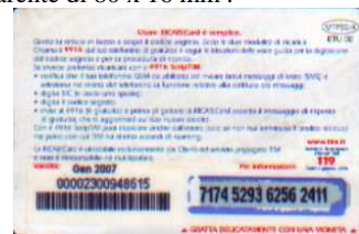
MTP30 - K/ 4CM Gen 07 retro