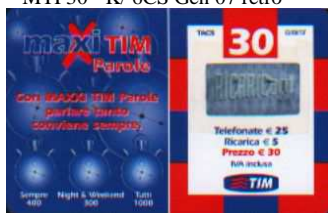
MTP30 - K Feb 07 verso