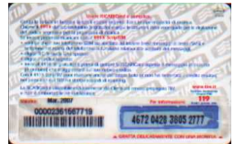
MTP30 - P/ 1CSDPN Mar 07 retro