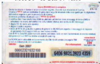
MTP30 - K/ 6CS Gen 07 retro