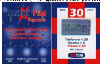
MTP30 - K Gen 07 verso