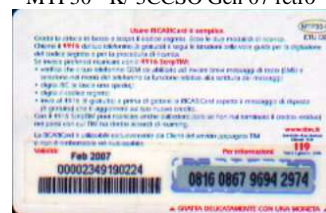
MTP30 - K/ 3CM2 Feb 07 retro