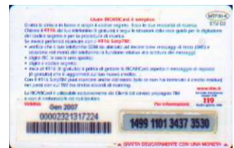
MTP30 - K/ 5CC Gen 07 retro