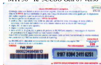
MTP30 - K/ CC Feb 07 retro