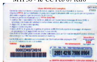
MTP30 - K/ 4CCPO Feb 07 retro