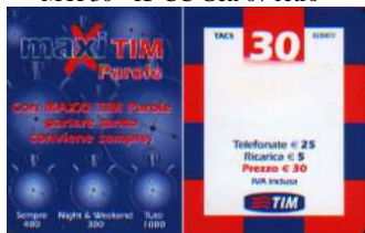
MTP30 - K/ 3CCSO Gen 07 verso