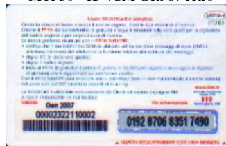
MTP30 - K/ 3CCSO Gen 07 retro