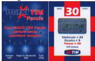
MTP30 - P/ DP Mar 07 verso