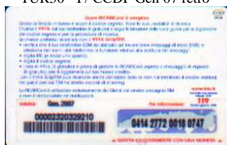
TUR30 - P/ 5CCDP Gen 07 retro