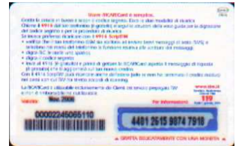
TUR30 - P/ 2CCDP Nov 06 retro