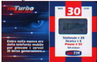
TUR30 - P Nov-Dic 06; Gen-Giu 07 verso