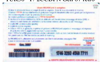
TUR30 - P/ 6CCDP Gen 07 retro