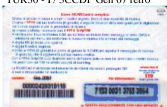
TUR30 - P/ CSDP Giu 07 retro