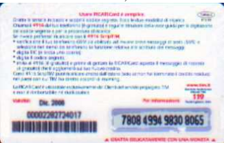
TUR30 - P/ CM7 Dic 06 retro