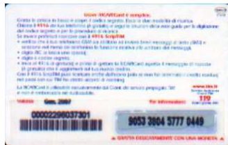
TUR30 - P/ CCDP Gen 07 retro