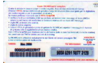
TUR30 - P/ 1CCDP Nov 06 retro