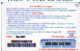
TUR30 - P/ 4CCDP Gen 07 retro