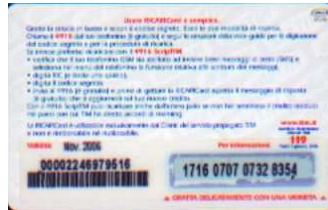
TUR30 - P/ CM5 Nov 06 retro