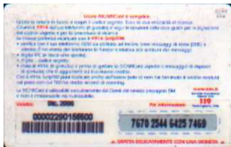
TUR30 - P/ CCDP Dic 06 retro