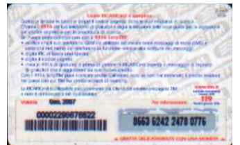
TUR30 - P/ 2CCDPN Gen 07 retro