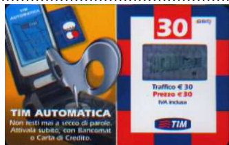
AUT30-C Apr-Lug-Ago-Set-Ott-Nov-Dic 09 verso