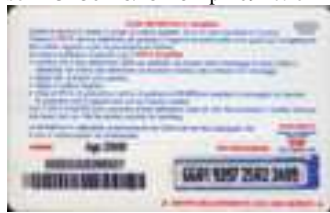
AUT30 - C/ 1CM4 Ago 09 retro