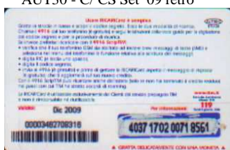
AUT30 - C/ CS Dic 09 retro