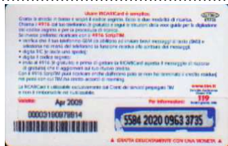
AUT30 - C/ CM8 Apr 09 retro