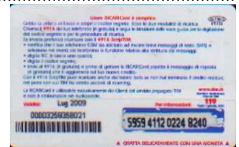
AUT30 - C/ CM4 Lug 09 retro