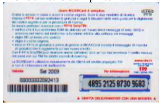
AUT30 - C/ CS Set 09 retro