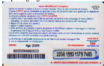
AUT30 - C/ CM4 Ago 09 retro