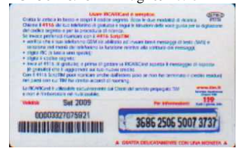
AUT30 - C/ 2CS Set 09 retro