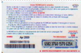
AUT30 - C/ 5CS Apr 09 retro