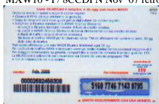
MXW10 - P/3CCDP Feb 08 retro