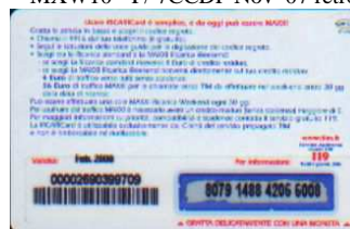
MXW10 - P/1CCDP Feb 08 retro