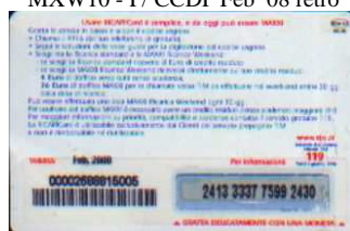
MXW10 - P/6CMDP Feb 08 retro