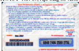
MXW10 - P/8CCDPN Nov 07 retro