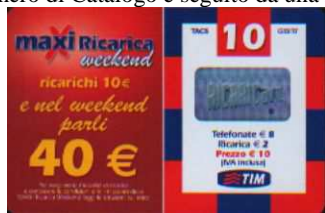
MXW10-P Nov 07; Apr-Mag 08 verso