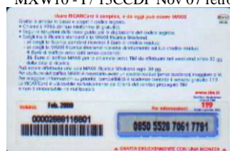
MXW10 - P/5CM5DP Feb 08 retro