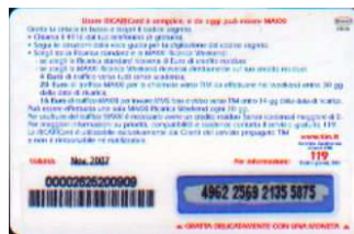
MXW10 - P/5CM5DP Nov 07 retro