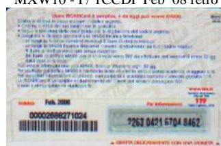
MXW10 - P/6CMDP Feb 08 retro