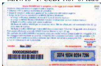
MXW10 - P/13CCDP Nov 07 retro