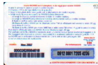
MXW10 - P/7CCDP Nov 07 retro