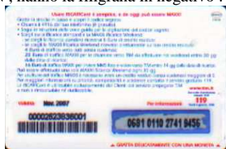
MXW10 - P/CCDP Nov 07 retro