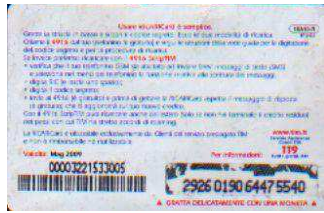
1XA10-R/ CM5DP Mag 09 retro