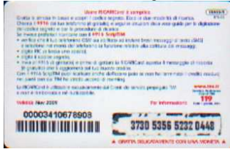
1XA10-R/ 3CCDP Nov 09 retro