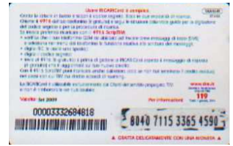
1XA10-R/ CSDP Set 09 retro