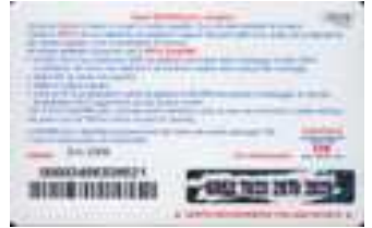
1XA10-R/ CM5DP Dic 10 retro