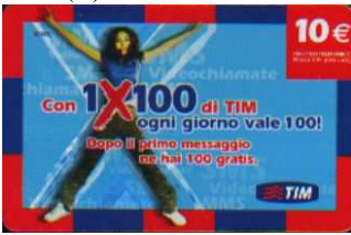
1XA10-R Mag- Lug-Set- Nov 09 verso