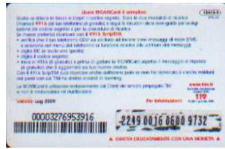
1XA10-R/ CSDP Lug 09 retro