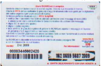
1XV5 - R/ CM5 Dic 09 retro