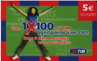
1XV5-R Lug-Ott-Nov-Dic 09 verso