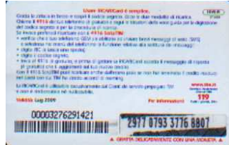
1XV5 - R/ CM6DP Lug 09 retro