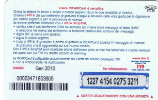
MAL20 - C/ 5CM4 Gen 10 retro