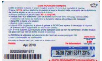
MAL20 - C/ 2CM8 Apr 10 retro