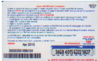
MAL20 - C/ 1CM10 Apr 10 retro