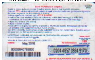
MAL20 - C/ CS Mag 10 retro