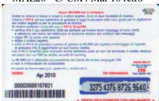
MAL20 - C/ 3CM10 Apr 10 retro