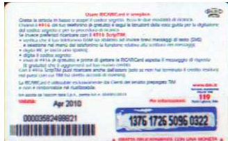
MAL20 - C/ CM8 Apr 10 retro