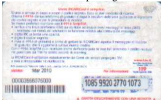
MAL20 - C/ CM4 Mar 10 retro