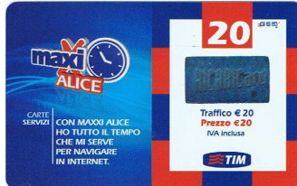
MAL20-C Gen-Feb-Mar-Apr-Mag 10 verso