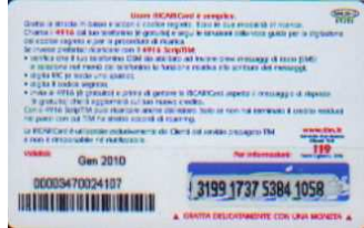
MAL20 - C/ CM4 Gen 10 retro