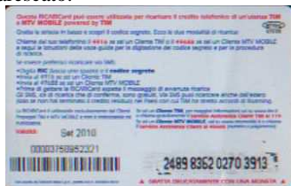
MTV5 - C/ CM4 Set 10 retro