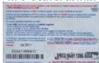
MTV5 - C/ CM4 Ott 11 retro