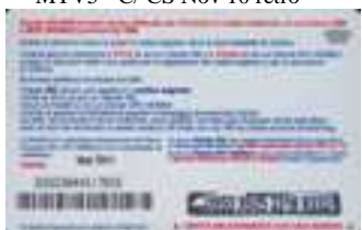
MTV5 - C/ CM4DP Mar 11 retro