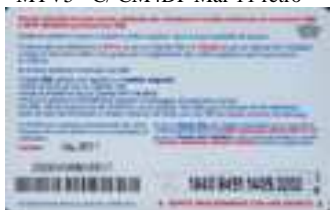
MTV5 - C/ CM4 Giu 11 retro