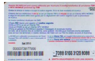
MTV5 - C/ 3CM4DP Set 10 retro