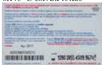
MTV5 - C/ CM4 Apr 11 retro