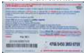
MTV5 - C/ CM5DP Feb 12 retro