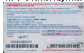
MTV5 - C/ CM4 Lug 11 retro