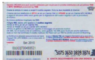
MTV5 - C/ 1CM4 Set 10 retro