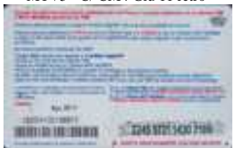
MTV5 - C/ CM4DP Ago 11 retro