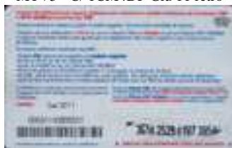
MTV5 - C/ CM4 Set 11 retro