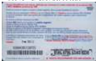
MTV5 - C/ CM7 Feb 12 retro