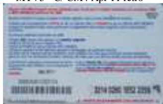
MTV5 - C/ 1CM4DP Giu 11 retro