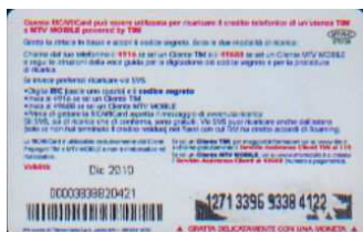
MTV5 - C/ CM4 Dic 10 retro