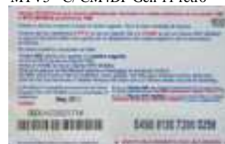
MTV5 - C/ 5CM4DP Mag 11 retro