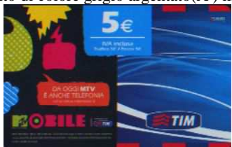
MTV5 - C Set-Nov-Dic 10; Gen-Mar-Apr -Mag Giu-Lug-Ago.Set-Ott-Dic 11; Feb 12 verso