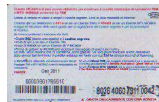
MTV5 - C/ CM4DP Gen 11 retro