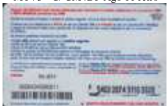
MTV5 - C/ 2CM4DP Dic 11 retro