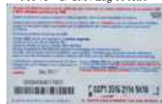
MTV5 - C/ CM4 Dic 11 retro