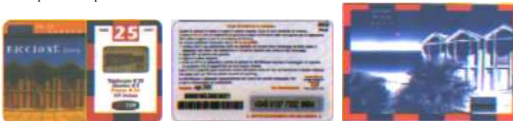
2RI25-M Ago. 05 verso