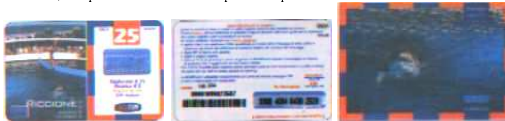
2RI25-M Lug. 04 verso

Dati tecnici : Le Ricariche 2RI25-M, realizzate dalla Mantegazza, in Cloruro di Polivinile (PVC), sono state vendute dalla TIM nella manifestazione indetta a Riccione, nel mese di Agosto 2002, sul collezionismo delle schede e delle Ricariche telefoniche. Hanno sul lato sinistro l'immagine del delfinario con l'istruttore che gioca con un suo “ allievo ” e “ RICCIONE NOON 30 Agosto 1 Settembre ” e il simbolo della manifestazione. Vendute in un folder Cartolina ( FC ) di 146 x 104 mm, hanno sul lato destro, circoscritto da una cornice multicolore, i dati d'esercizio, in cifre, alte 7,5 mm. Il costo della Ricarica è indicato in Euro. In alto TACS di 5 mm e GSM di 6 mm. Al centro l'ologramma RICARICARD di 24,5 x 14 mm e in basso il Logo TIM di 14 mm senza motto. Sul retro, che ha filigrana piana e indicazioni in italiano, “ Usare RICARICARD è semplice ” e, a seguire, “ Gratta la striscia in basso e scopri il codice segreto ” e, ETU-D 2. Per ricaricare 4916 o 4916 ScripTIM. Per le informazioni sopra il Servizio Assistenza Clienti TIM 119 www.tim.it . Il nuovo Codice Numerico, a 14 cifre, posto sopra il Codice a Barre, e il Codice Segreto ( PIN ), con caratteri marcati e che sovrasta la dicitura “ Gratta delicatamente con una moneta ”, posta tra due frecce, è stampato su un supporto di colore, grigio chiaro ( C ), ed è ricoperto da un Pigmento di colore Celeste, sono protetti da una membrana di plastica trasparente di 80 x 16mm