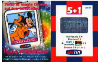
HR5+1-M Mar.- Apr. 05 verso