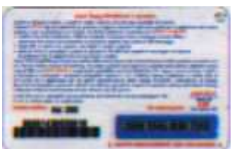
HR5+1-P Mar. 05 retro