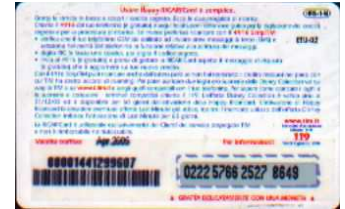
HR5+1-M Apr. 05 retro