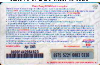
HR5+1-P/3N Apr. 05 retro