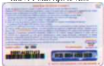
HR5+1-P Apr. 05 retro