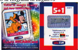
HR5+1-P Mar.-Apr. 05 verso