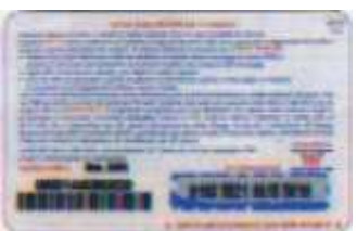
HR5+1-P/2 DP Mar. 05 retro