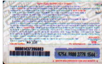
HR5+1-M/1 N Mar. 05 retro