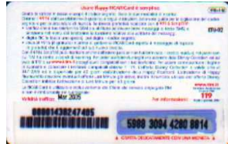
HR5+1-M Mar. 05 retro