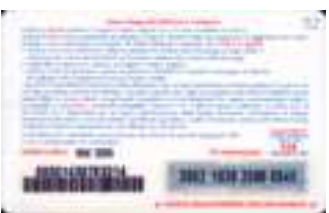
HR5+1-P/1 Mar. 05 retro