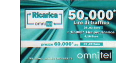
Ricarica 20.074, 20.076 verso

Ci sono : Segreteria Telefonica così “ Potete ascoltare i vostri messaggi chiamando il numero 2020 dal vostro telefono cellulare secondo i costi previsti dal vostro piano telefonico . “ Brevi Messaggi di Testo così “ avete la possibilità di inviare o ricevere messaggi scritti di una lunghezza massima di 160 caratteri “.