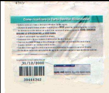
74 , 75, 76, 77 copertina retro

Le Ricariche 74, 75, 76, 77 hanno : al verso : sul bordo , il Codice Identificativo Commerciale ( I S B N ) , “l'immagine e i dati relativi alla “ RICARICA OMNITEL “ con 50.000 Lire e 100.000 Lire di traffico + 10.000* Lire ( 5,16 Euro ) per la ricarica . Al centro : “ prezzo 60.000* Lire ( 30,99 Euro ) “ , “ prezzo 110.000* Lire ( 56,81 Euro ) “ al retro: “ Come ricaricare la Carta Omnitel Ricaricabile “ la validità , il Codice a barre di 23,5 x 8,5 mm, il Codice Numerico , e una finestra , protetta da una plastica trasparente , di 35 x 10mm.