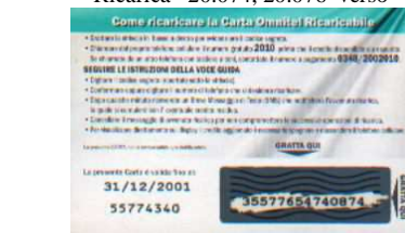
Ricarica 20.076 retro