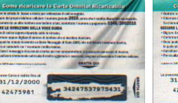
Ricarica 20.074 retro