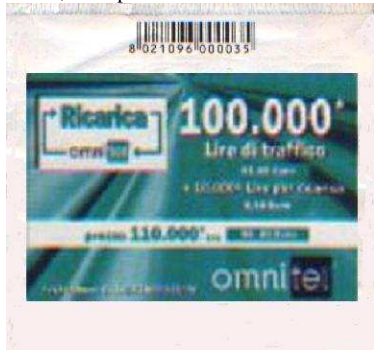
75 , 77 copertina verso

Le Ricariche 74, 75, 76, 77 hanno : al verso : sul bordo , il Codice Identificativo Commerciale ( I S B N ) , “l'immagine e i dati relativi alla “ RICARICA OMNITEL “ con 50.000 Lire e 100.000 Lire di traffico + 10.000* Lire ( 5,16 Euro ) per la ricarica . Al centro : “ prezzo 60.000* Lire ( 30,99 Euro ) “ , “ prezzo 110.000* Lire ( 56,81 Euro ) “ al retro: “ Come ricaricare la Carta Omnitel Ricaricabile “ la validità , il Codice a barre di 23,5 x 8,5 mm, il Codice Numerico , e una finestra , protetta da una plastica trasparente , di 35 x 10mm.