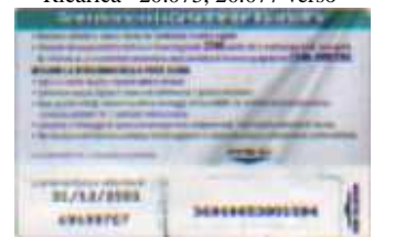
Ricarica 20.077 retro