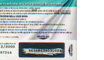
Ricarica 20.075 retro