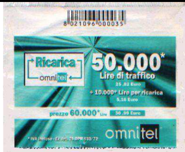
74 , 76 copertina verso

PROSPETTO DELLE COPERTINE , A DUE SEZIONI, OMNITEL REALIZZATE CON DUE MODULI , IN CARTONCINO LEGGERO .