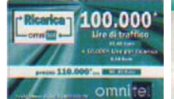
Ricarica 20.075, 20.077 verso