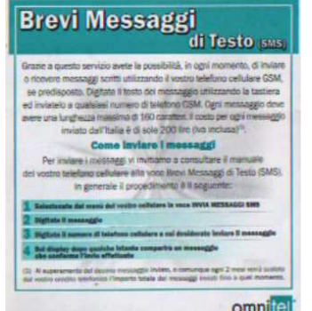
Retro del pieghevole inserito nelle 74 , 75, 76, 77 .

Ci sono : Segreteria Telefonica così “ Potete ascoltare i vostri messaggi chiamando il numero 2020 dal vostro telefono cellulare secondo i costi previsti dal vostro piano telefonico . “ Brevi Messaggi di Testo così “ avete la possibilità di inviare o ricevere messaggi scritti di una lunghezza massima di 160 caratteri “.