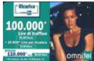
20.227, 20.227/1 verso