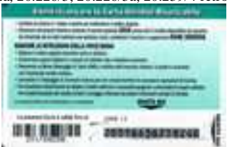
20.229, 20.229/1, 20.229/2, 20.230 retro