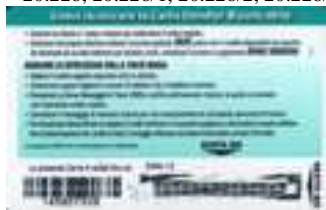
20.226, 20.226/1, 20.226/2, 20.226/2a, 20.226/3, 20.226/3a, 20.239/4 retro