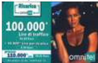
20.226, 20.226/1, 20.226/2, 20.226/2a, 20.226/3, 20.226/3a, 20.226/4 verso