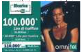
20.229, 20.229/1, 20.229/2, 20.230 verso