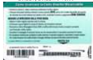
20.227, 20.227/1 retro