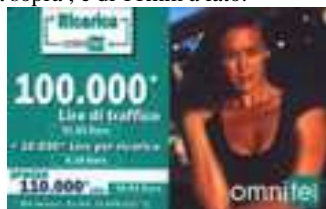
20.222, 20.222/1 verso

Dati tecnici : Le Ricariche OMNITEL, realizzate in Cloruro di Polivinile (PVC), crema , nel formato di 85,5 x 53,5 mm, con 100.000 Lire (51,65 Euro) di traffico, hanno sul lato sinistro, di colore verde carico (20.222, 20.222/1), e verde chiaro (20.223), verde giallo (20.224, 20.224/1, 20.224/2, 20.224/3 , 20.233 ) ,verde scuro ( 20.229, 20.229/1, 20.229/2 ) e verdi le restanti , Ricarica , Omnitel , in cartello, con il valore del traffico e della ricarica , che occupano 41,75 mm. Il prezzo, 110.000 Lire ( 56,81 Euro ), comprensivo di 10.000 Lire ( 5,16 Euro ) per la ricarica, con “ IVA inclusa -Ex Art, 74 DRP 633/72” , occupano uno spazio di 11,75 mm. Il logo OMNITEL è di 23,5 mm. Sul lato destro Megan Gale, in primo piano, con il volto illuminato dal sole e i capelli mossi dal vento del deserto. Il retro è lucido. Lo spazio, per “ Come ricaricare la Carta Omnitel Ricaricabile “ i cui dati , stampati con caratteri marcati, su fondo verde, occupano uno spazio di 38,75 mm e quello, dove è locata la validità , il codice a barre, il codice numerico e il codice segreto (PIN), 14,75 mm. Il mese di validità è in cifre. Il Codice Numerico è a cifre piccole, posto sotto il Codice a Barre . Il Codice Segreto (PIN), che è stampato su un fondo retinato , comincia sempre con il CODICE ed è evidenziato da una doppia dicitura “ GRATTA QUI “ , nera , di 10 mm , posta sopra , e di 11mm a lato.