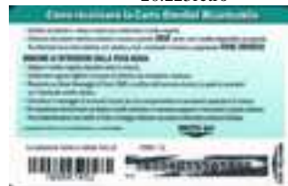
20.224/2, 20.224/3 retro