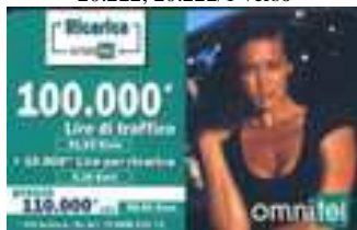
20.224, 20.224/1, 20.224/2, 20.224/3 verso