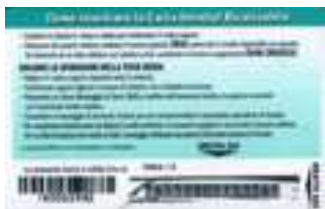
20.222, 20.222/1 retro