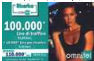
20.224/4, 20.224/5 verso