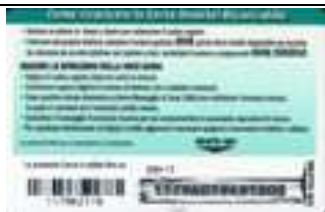
20.242, 20.242a, 20.242/1 retro