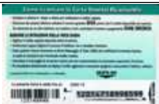
20.243, 20.243/1, 20.243/2, 20.243/3, 20.243/4 retro