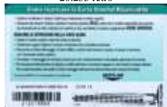
20.238, 20.238/1 retro