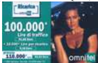
20.234, 20.234/1, 20.236, 20.236/1 verso

Dati tecnici : Le Ricariche OMNITEL, realizzate in Cloruro di Polivinile (PVC), bianco, nel formato di 85,5 x 53,5 mm, con 100.000 Lire (51,65 Euro) di traffico, hanno sul lato sinistro, di colore verde (20.234, 20.234/1, 20.236, 20.236/1, 20.237, 20.240, 20.241), e verde scuro (20.235, 20.239), Ricarica , Omnitel , in cartello, con il valore del traffico e della ricarica, che occupano 41,75 mm . Il prezzo, 110.000 Lire ( 56,81 Euro ), comprensivo di 10.000 Lire ( 5,16 Euro ) per la ricarica, con “ IVA inclusa -Ex Art, 74 DRP 633/72”, occupano uno spazio di 11,75 mm . Il logo OMNITEL è di 23,5 mm. Sul lato destro Megan Gale, in primo piano, con il volto illuminato dal sole e i capelli mossi dal vento del deserto. Il retro è lucido. Lo spazio, per “ Come ricaricare la Carta Omnitel Ricaricabile “ i cui dati , stampati con caratteri marcati, su fondo verde, occupa uno spazio di 35 mm e quello, dove è locata la validità , il codice a barre, il codice numerico e il codice segreto (PIN), 18,5 mm. Il mese di validità è in cifre. Il Codice Numerico è a cifre grandi, posto sotto il Codice a Barre . Il Codice Segreto (PIN), che è stampato su un fondo retinato , comincia sempre con il CODICE ed è evidenziato da una doppia dicitura “ GRATTA QUI “, nera , di 10 mm , posta sopra , e di 1mm a lato.