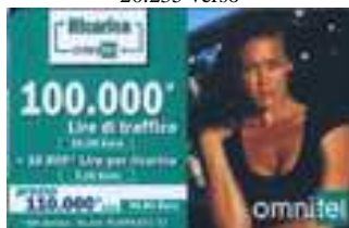
20.238, 20.238/1 verso