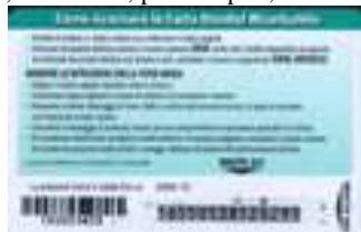
20.234, 20.234/1, 20.236, 20.236/1 retro