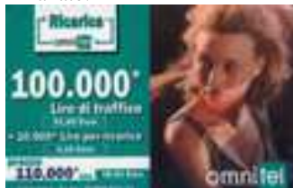
20.242a , 20.242/1, 20.243, 20.243/1, 20.243/2, 20.243/3, 20.243/4 , 20.244 verso