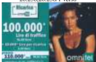
20.240, 20.241, 20.241/1, 20.241/1a verso