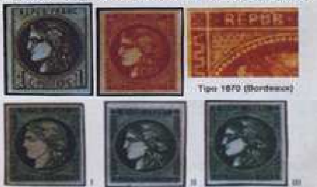
Tipi 1870 (Bordeaux)

1870-71 - Carere. Emissione di Bordeaux. Tipo del 1842-50 modificato. Carta leggermente colorata. Stampa litografica. I n. 39-41 hanno la fig. Carere con grandi cifre mentre i n. 42-49 hanno le cifre piccole.