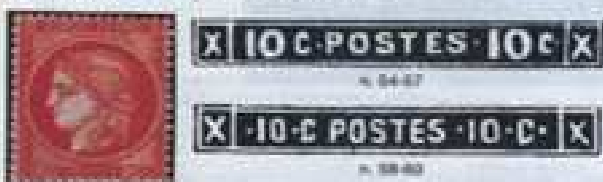
Stesso tipo. Cifre piccole nel riquadro inferiore.